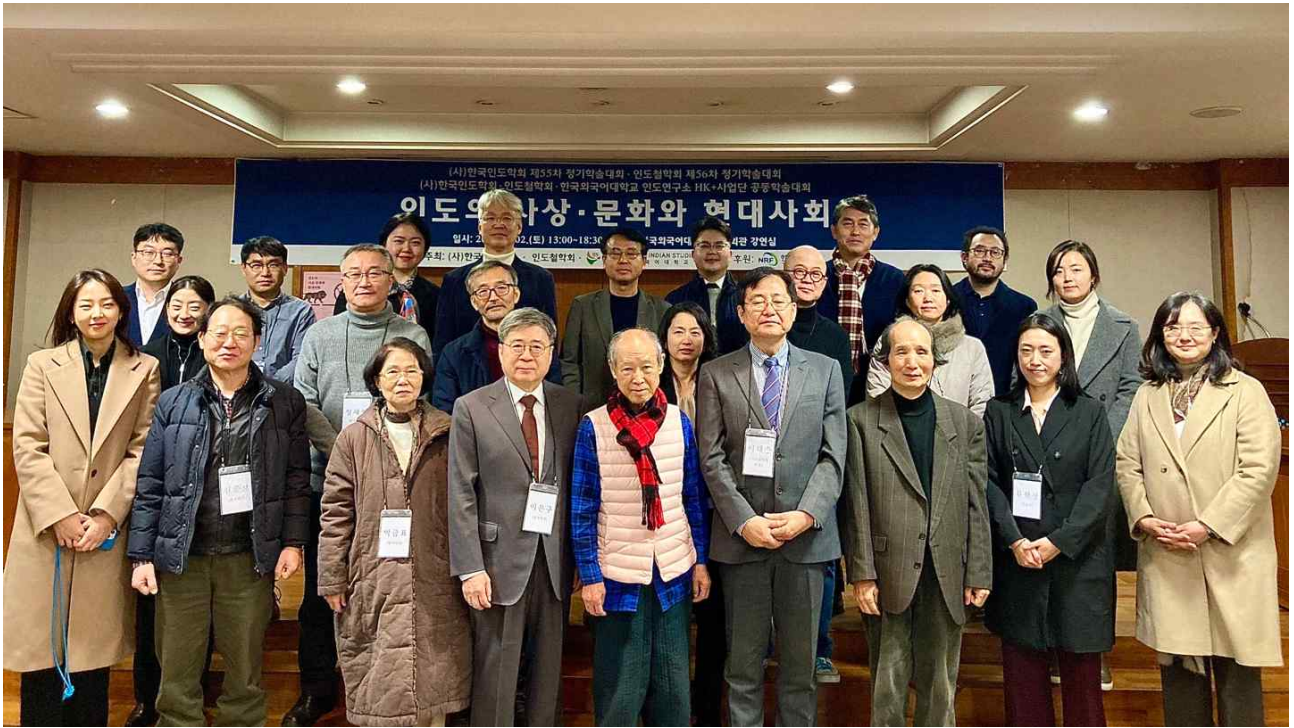
기념촬영 Commemorative Photograph